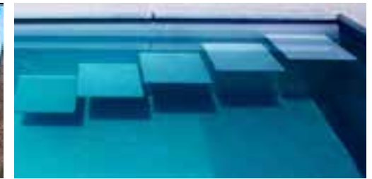
Schwebende Treppe: nur konzipieren aufgrund der hervorragenden Materialien.