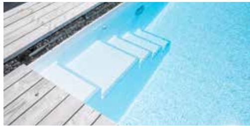
Valencia: 4 oder 5-stufige Treppe in den Breiten 50, 80 und 100 cm.

Die Kanten der Treppen können farblich oder mit einem Lichtband abgesetzt werden. Möglich sind beleuchtete Kanten in warm weiß, kalt weiß oder in verschiedenen Farben. Das Leuchtmittel sitzt hinterm Becken, damit keine Feuchtigkeit eindringen kann.