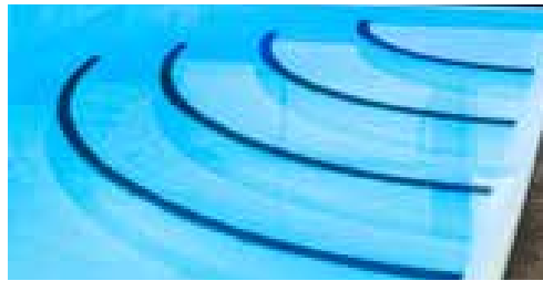
St. Tropez: Eine 4-stufige Viertelkreis Treppe, die als Treppe Bordeaux oder auch als Römische Treppe erhältlich ist.

Die perlenden Stufen wurden im März 2017 mit dem Golden Wave in der Kategorie Pool-Attraktionen ausgezeichnet. - Lassen Sie sich in Ihrem Pool von tausenden kleinen Luftblasen massieren -